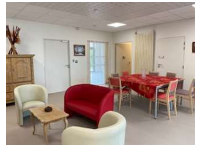
Centre Hospitalier Aunay Bayeux 13 rue Nesmond 14400 BAYEUX

« Le souvenir, c'est ce qu'il reste de mémoire à l'oubli » A De Régnier